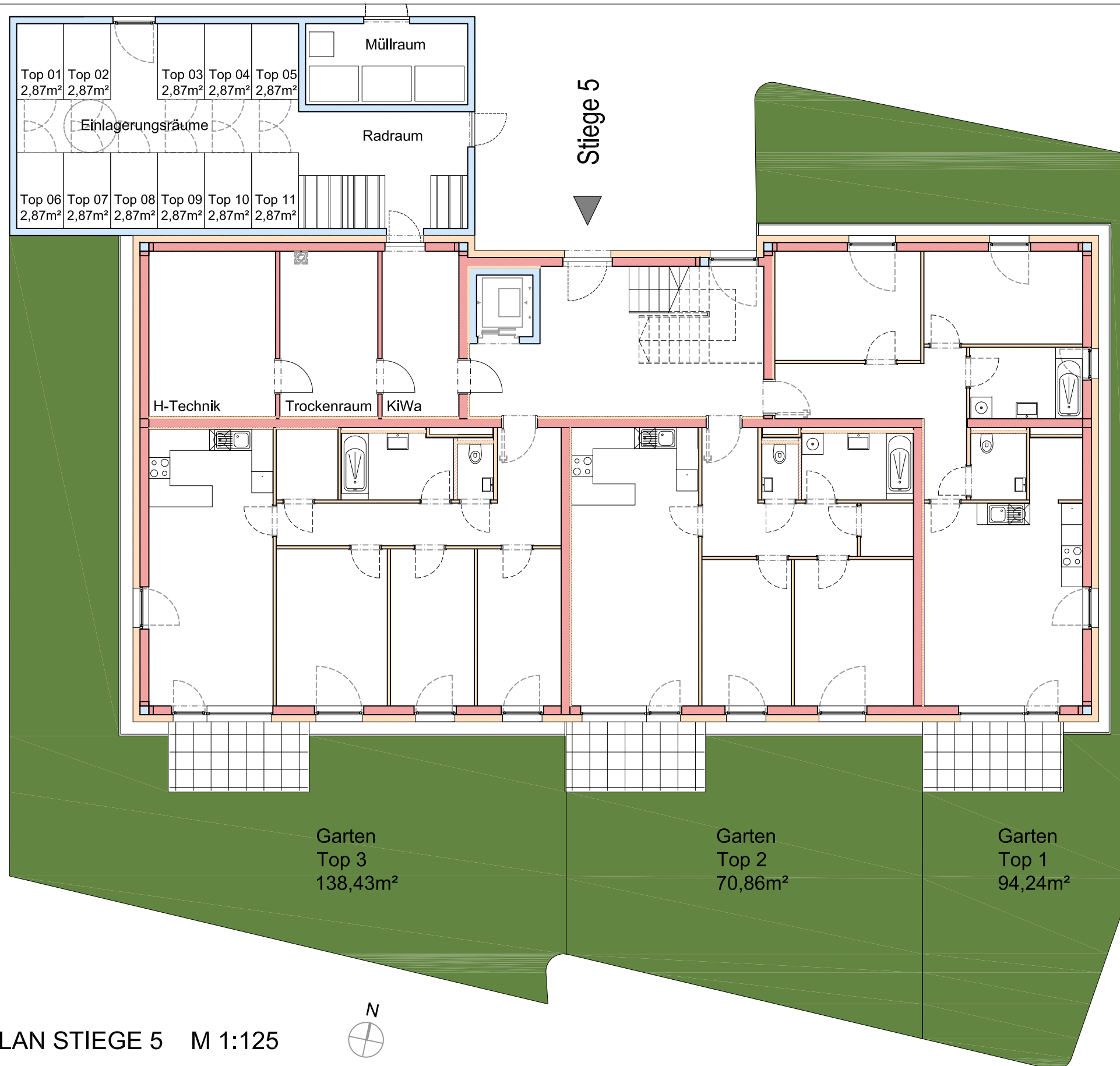
ÜBERSICHTSPLAN STIEGE 5 M 1:125