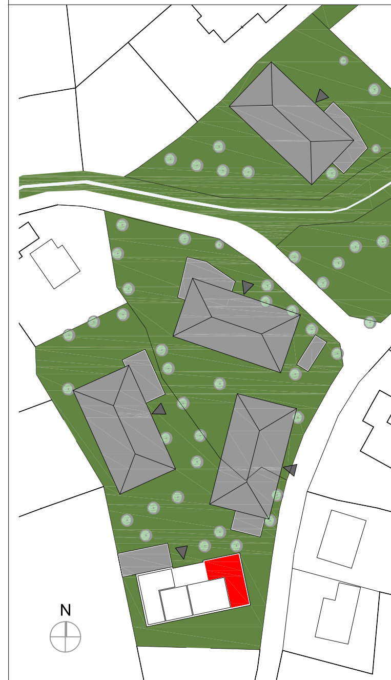
Übersichtsplan M 1:1000