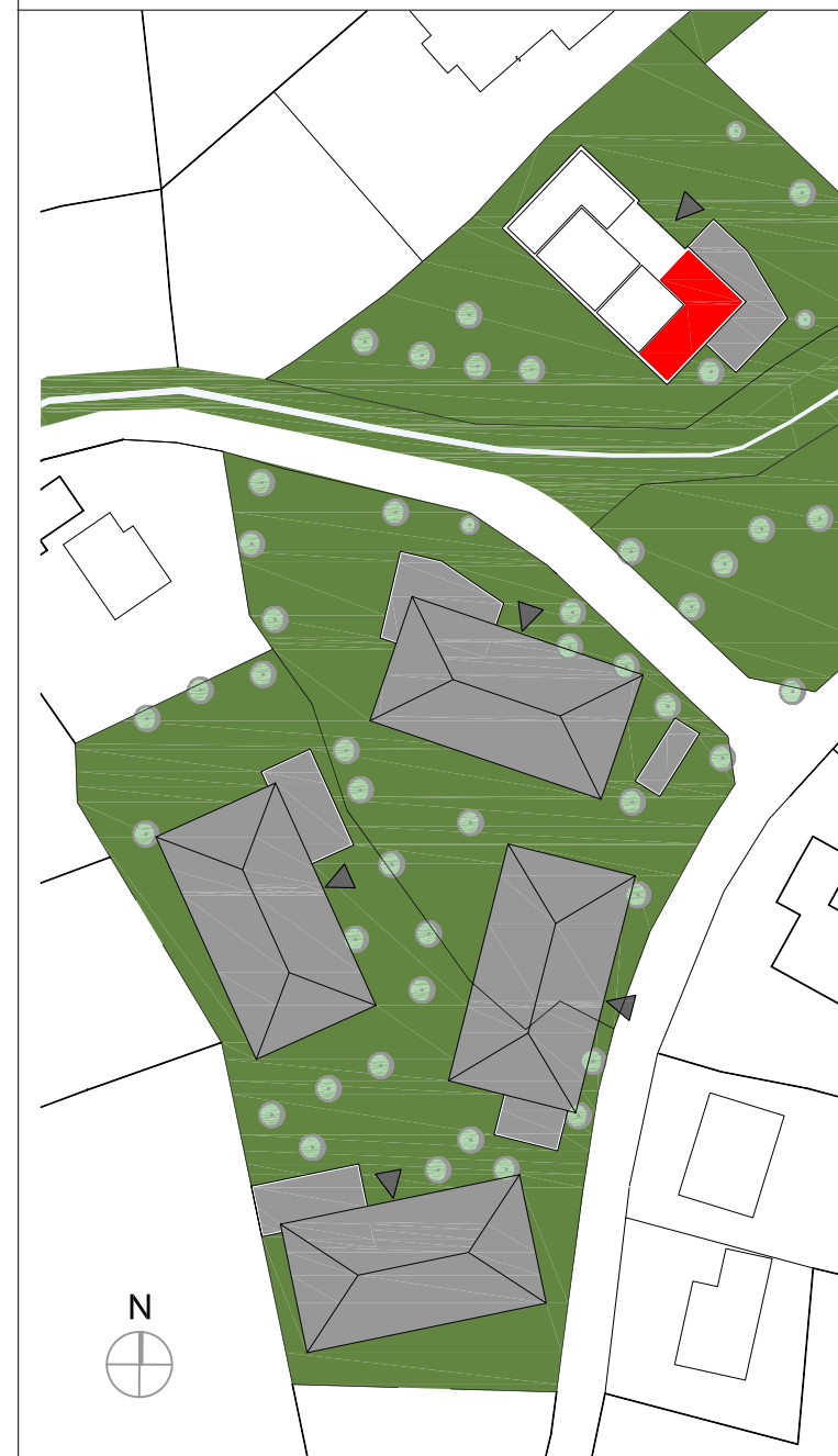
Übersichtsplan M 1:1000